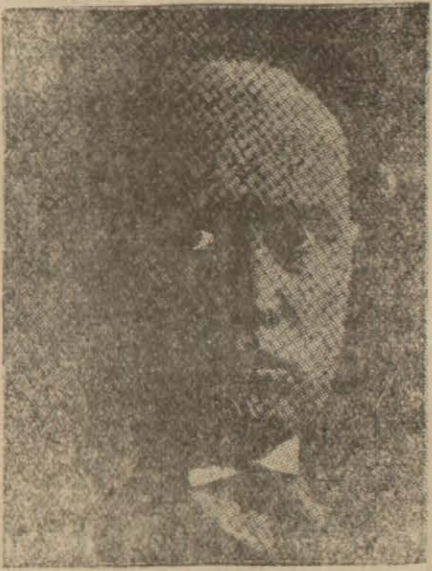
İtalyan Başbakanı Musolini ederek sözlerine son vermiştir .

İtalyanların Habeşistandan yüksek olduğunu söyledi ve eski mağlûbiyetin sebebini bildirdi